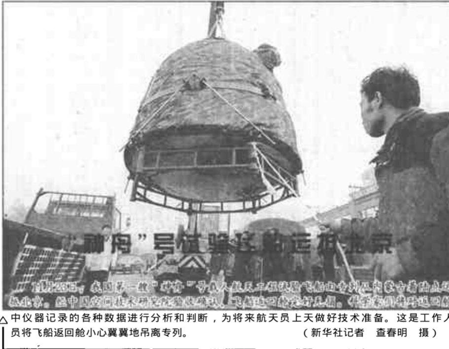
△中仪器记录的各种数据进行分析和判断,为将来航天员上天做好技术准备。这是工作人员将飞船返回舱小心翼翼地吊离专列。

莫伊表示完全同意李鹏的看法。他说,非洲国家人民从50年代起就全面展开了争取自由平等、打破殖民枷锁、谋求国家独立的斗争,在漫长的斗争中,得到了中国政府和人民的同情、支持和帮助,非洲人民对此深怀感激之情。独立后,非洲人民面临的重大问题就是贫困,殖民主义造成的严重后果,冷战时期人为造成的政治分野,以及当今国际经济和贸易组织对非洲经济命脉的控制,使非洲难以走上全面振兴之路。我热烈祝贺中美就中国加入世贸组织达成协议,中国的加入是对我们的一种支持,使发展中国家在世贸组织中的声音更加有力。莫伊说,我们肯尼亚人深刻认识到,财富不能靠别人施舍,只能靠我们自己去奋斗争取。发展中国家也要团结起来,去努力争取我们的权益。